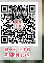
掃一掃，更多精彩新聞與你分享

(新華社北京3月27日電)日元對美元匯率27日跌至1990年以來最低。日元對美元匯率當天一度跌至1美元兌換151.975日元，促使日本財務大臣鈴木俊一警告將採取「堅決行動」干預匯市。日元匯率應聲收復部分失地。與之對比，美元指數當天上漲0.07%至104.36。鈴木上次使用同樣措辭是在2022年下半年，財務省隨後出手干預日元匯率。